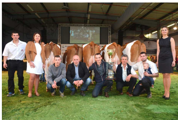
Photos du lot d'élevage du CE de Lure-Noroy Saulx, vainqueur du trophée.

En 2016, la Chambre d'Agriculture a également apporté son appui à l'organisation des manifestations d'élevage suivantes :